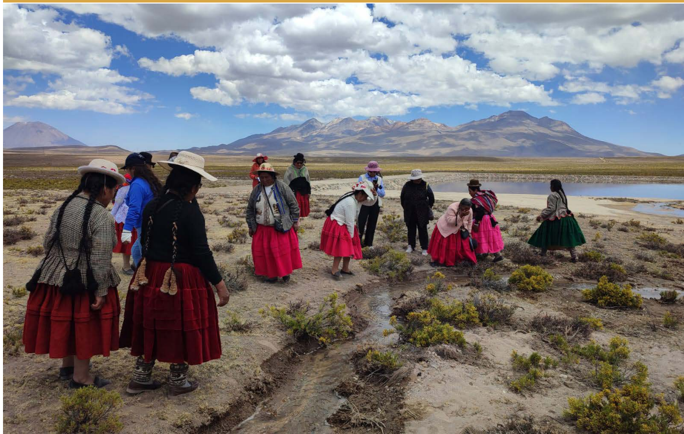
Mujeres de Wiñay Warmi aprendiendo sobre la siembra y cosecha de agua en Pampa Cañahuas.

Por Analiz Huamani Huaman y Estrella Sánchez Carazas*