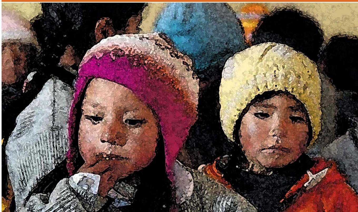
Las acciones contra la anemia infantil en Puno serán prioridad en el 2026. Puno es la región más afectada por la anemia a nivel nacional.