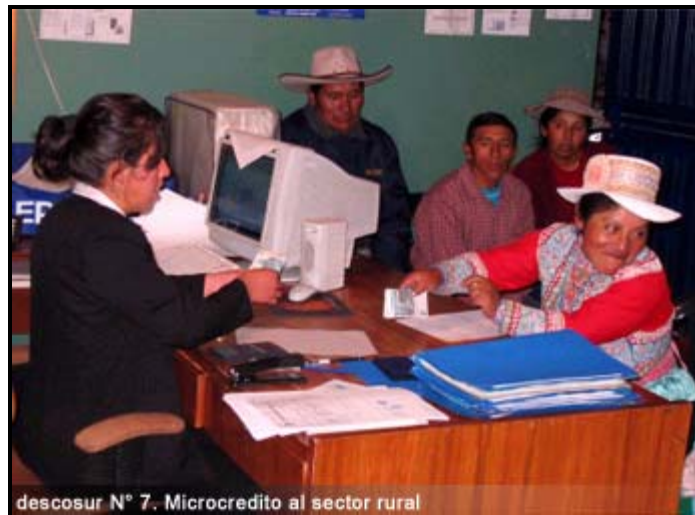
descosur N° 7. Microcredito al sector rural

Inició sus operaciones en abril de 1994 y hasta julio del 2006 ha colocado más de U.S. $ 16.000.000 en 17.100 operaciones de crédito. La cartera vigente a la fecha asciende a $ 1.800.000. Estos créditos han permitido el acceso al crédito de los pobladores rurales, crear una cultura de pago y contribuir a dinamizar e incrementar las economías locales y familiares.