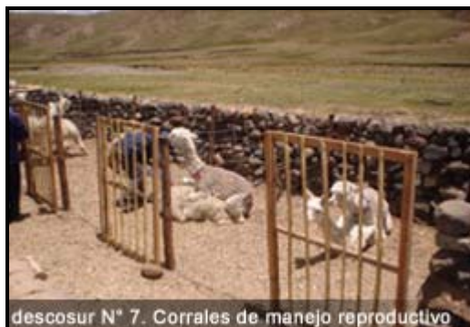
descosur N° 7. Corrales de manejo reproductivo