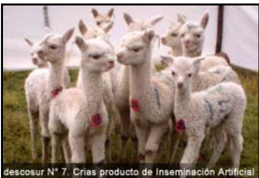
descosur N° 7. Crias producto de Inseminación Artificial