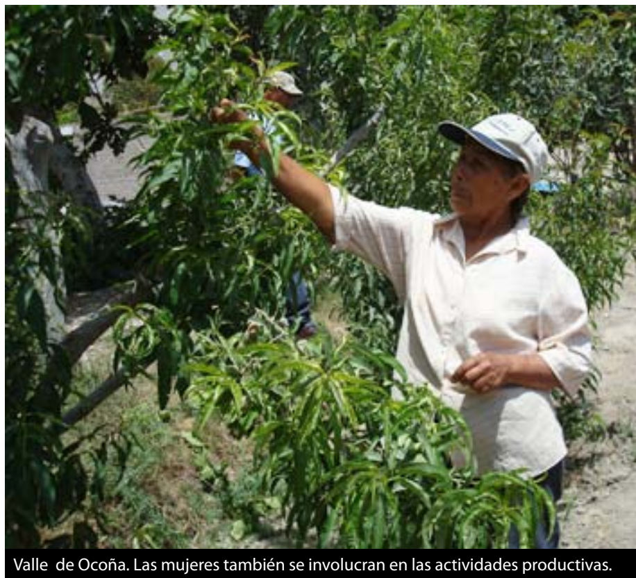
Valle de Ocoña. Las mujeres también se involucran en las actividades productivas.

de los presupuestos participativos), logrando incorporar proyectos de desarrollo productivo en la priorización de los presupuestos participativos, a pesar de sus limitaciones.