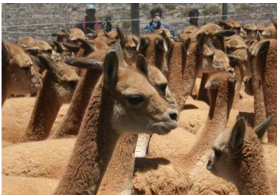
La población de vicuñas se ha incrementado en la Reserva de Salinas y Aguada Blanca.