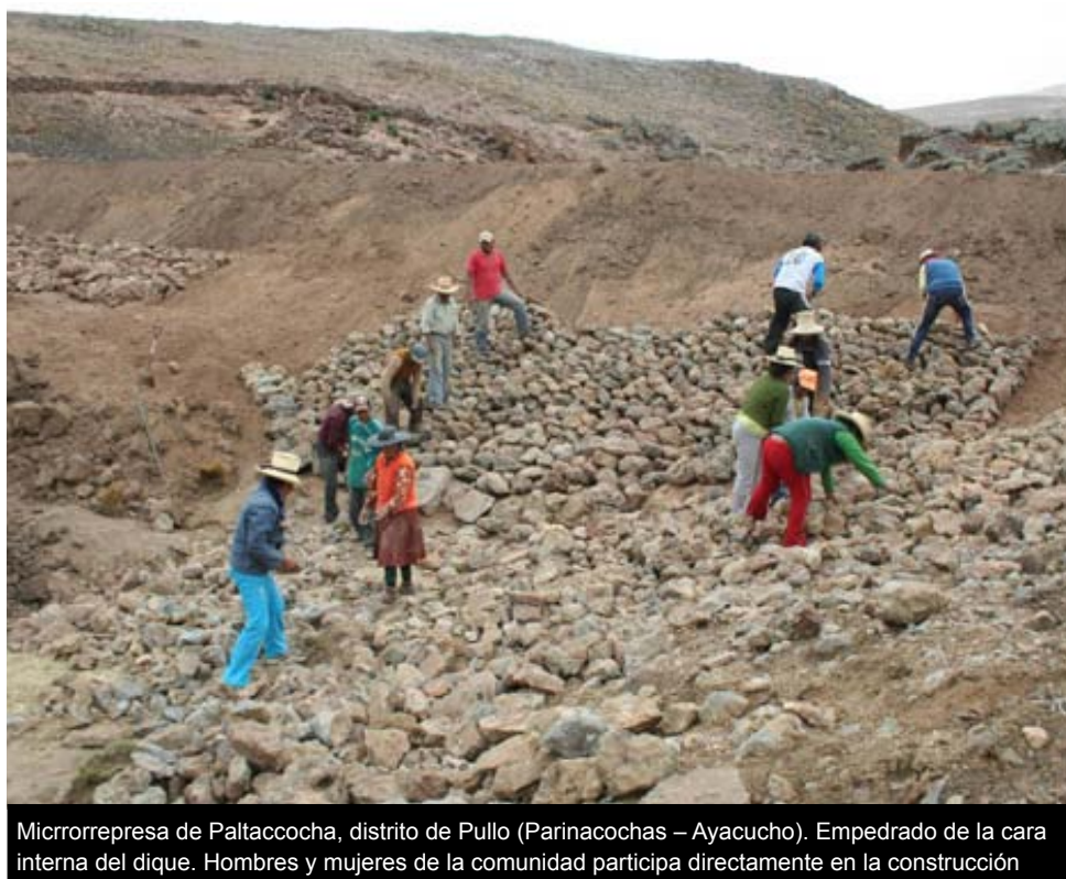
Microrrepresa de Paltacocha, distrito de Pullo (Parinacochas – Ayacucho). Empedrado de la cara interna del dique. Hombres y mujeres de la comunidad participa directamente en la construcción

En el sur de Ayacucho, en la provincia de Parinacochas se ha construido la primera micro represa, en la comunidad de Parani del distrito de Pullo, con capacidad de almacenamiento de 20,000 m 3