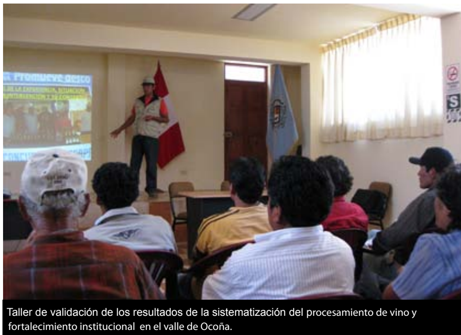
Taller de validación de los resultados de la sistematización del procesamiento de vino y fortalecimiento institucional en el valle de Ocoña.

da en el Programa, respecto al tema de manejo ambiental y conservación de recursos naturales, estas acciones forman parte de un componente transversal en todos los proyectos y en todas las UOT, los mismos que responden de acuerdo a las características propias de cada ámbito, con acciones relacionadas al tema, en unos la recuperación de andenerías (Caylloma y Sara Sara), construcción de micro represas (Arequipa, Caylloma, Moquegua, Ayacucho), mejoramiento de infraestructuras de riego (todos los ámbitos del Programa), fortalecimiento de las organizaciones de riego para optimizar el uso del agua de riego (todos los ámbitos del Programa), ampliación y mejora de la frontera de las pasturas natu-