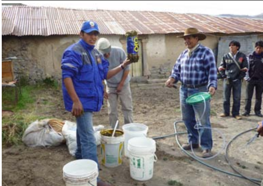
Taller de elaboración de biol en Yanque, una de las actividades para el tratamiento de residuos