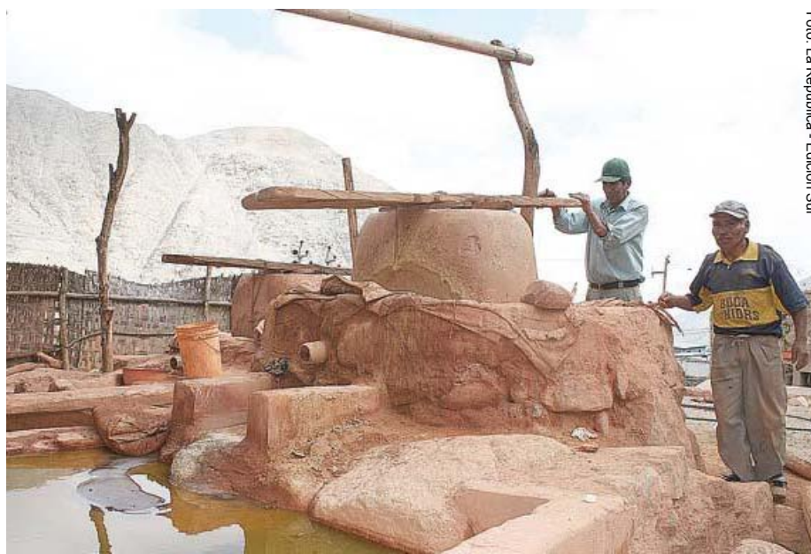
Caravelí. Los quimbaletes son utilizados por los mineros informales para procesar oro

Los problemas ocasionados por la minería informal se hicieron más evi-