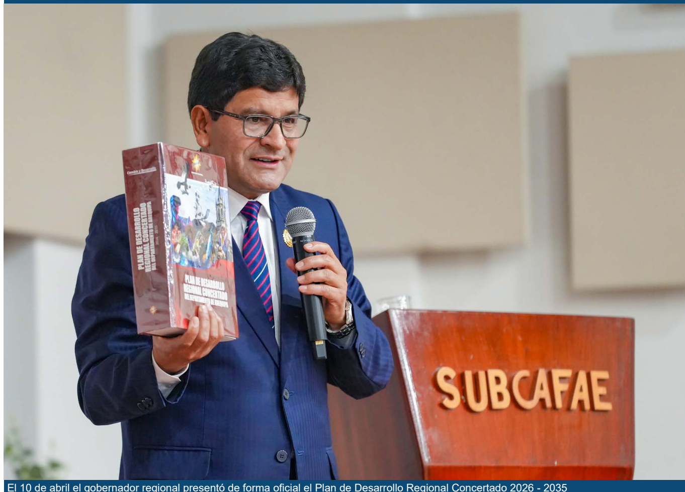
El 10 de abril el gobernador regional presentó de forma oficial el Plan de Desarrollo Regional Concertado 2026 - 2035