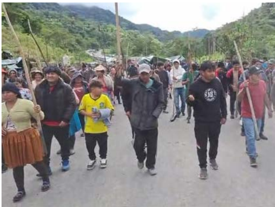
El 22 de junio, en Bolivia se levantaron los bloqueos que paralizaron buena parte del país durante más de 50 días, pero la crisis política sigue abierta. La tregua es temporal.

La estructura de esta formación explica la existencia de un Estado aparente, el cual suele operar con una autonomía relativa limitada por su sujeción al «superestado» de las facciones dominantes. Históricamente, esto ha permitido que el aparato esta-