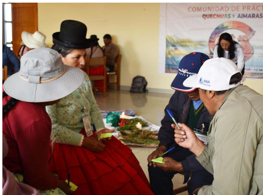
Taller presencial de la comunidad de prácticas. Intercambio dialogado de experiencias.

“ En el grupo debemos de intercambiar las experiencias aprendidas en el transcurso de las capacitaciones y también las experiencias vividas en los años que hemos pasado”