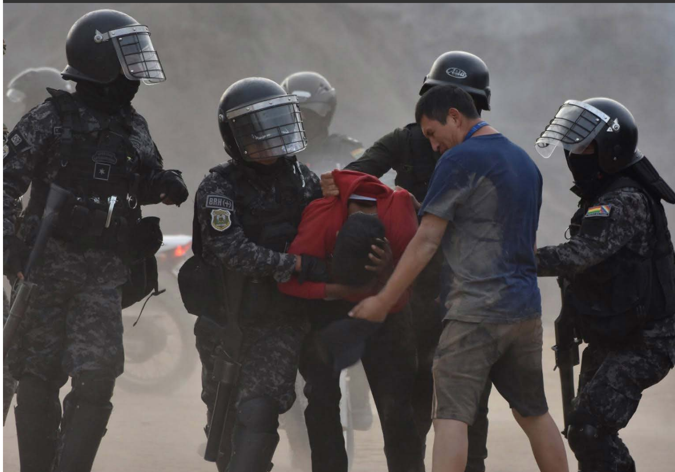
La represión policial y militar de Rodrigo Paz al pueblo movilizado en Vinto - Quillacollo - Cochabamba - Bolivia.