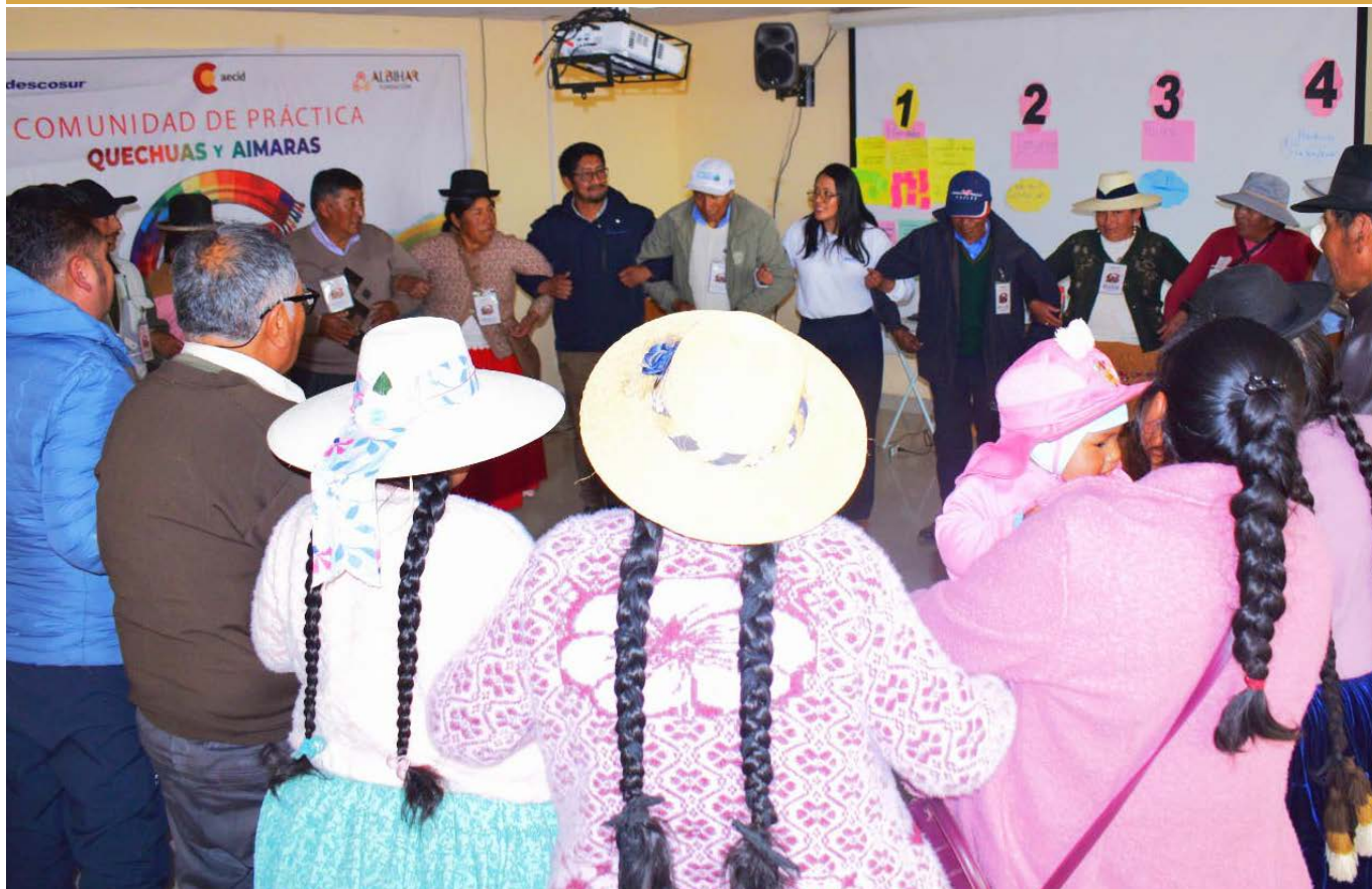
Círculo comunitario. Reforzando compromiso en la comunidad de práctica quechuas y aimaras.