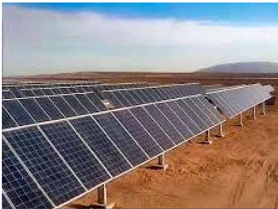
El PDRC plantea que el 30% matriz energética de la región al 2035 será renovable.

La implementación estará a cargo de las distintas gerencias regionales, con monitoreo continuo a través de los 92 indicadores definidos y participación activa de gobiernos locales, universidades y sociedad civil, en articulación con los Objetivos de Desarrollo Sostenible (ODS).