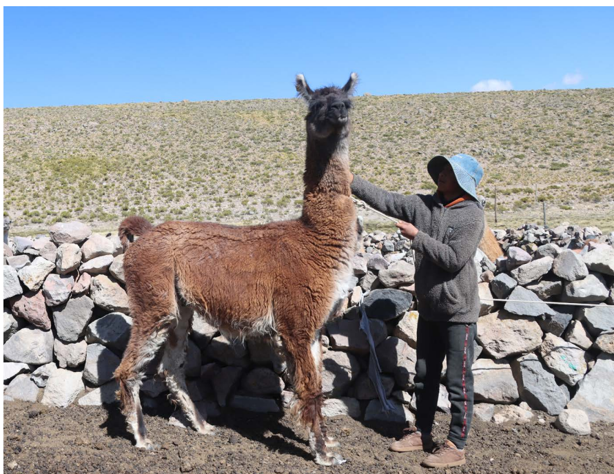
En Perú hay 746,306 llamas, según el último Censo Nacional Agropecuario (IV CENAGRO).

Sí. La llama se usó principalmente para transporte, intercambio de bienes de las zonas altas con las zonas bajas, o transporte de minerales, llevaban un mercurio de trabajo desde Huancavelica hasta, dicen, las minas de Potosí en Bolivia. Pero eso, con la aparición de las mejores vías de comunicación, motos, mejores vehículos, ya perdió, digamos, su uso. Ahora básicamente es para carne, creo que la carne sí tiene un potencial económico para trabajarlo; pero, aun así, el mercado todavía no se ha levantado como el mercado de carne de alpa-