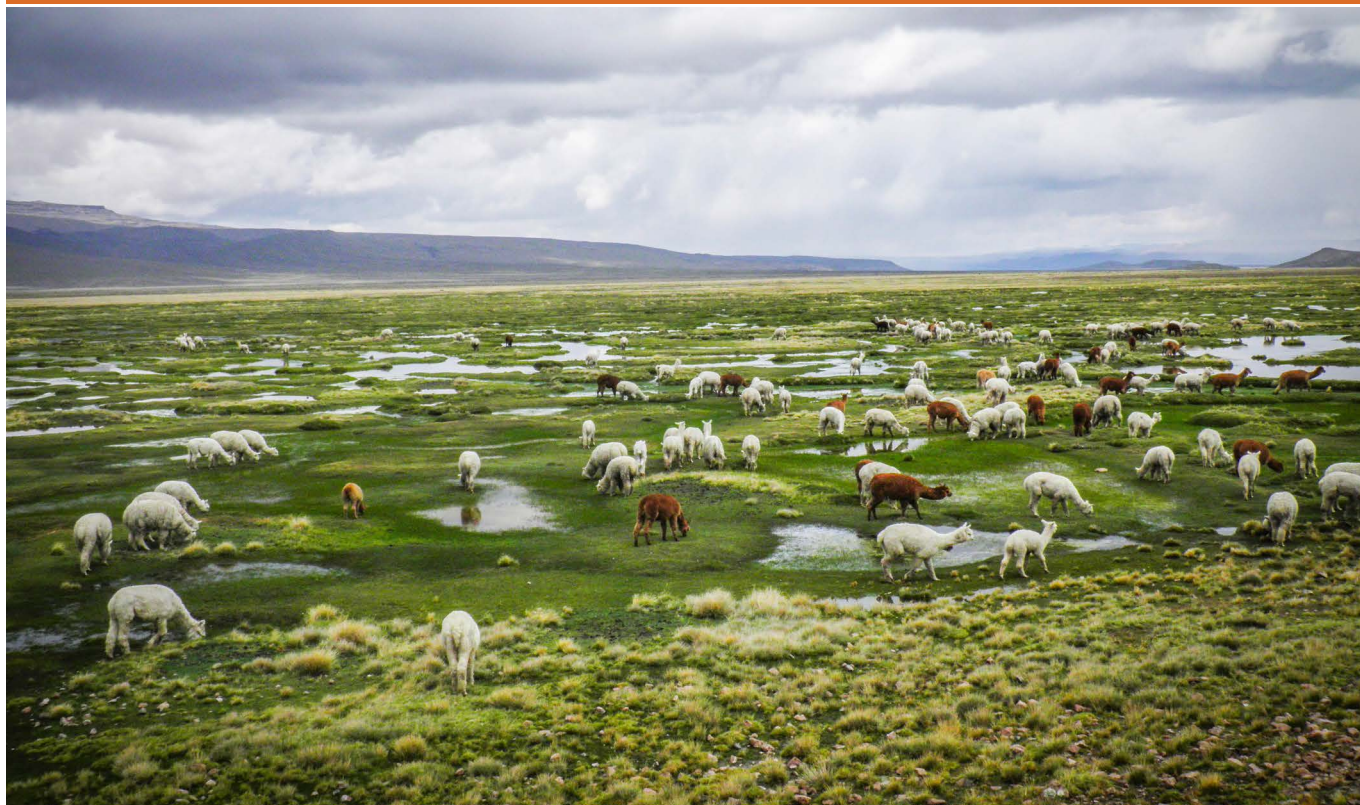
Bofedal en la Reserva Nacional de Salinas y Aguada Blanca. Puno, Arequipa, Ayacucho y Cusco concentran grandes hectáreas de bofedales.