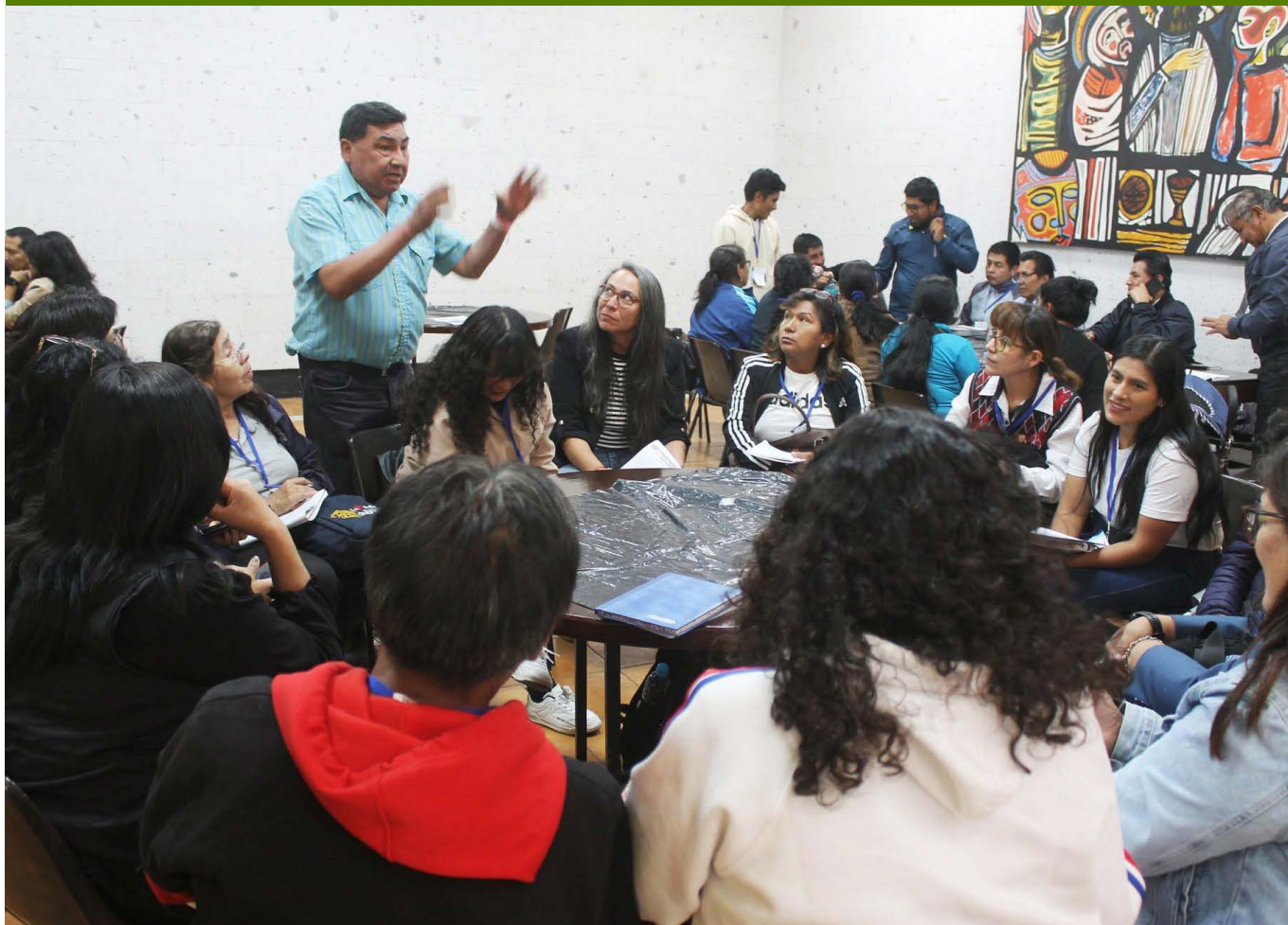
Durante la capacitación las docentes y los docentes desarrollaron diversos trabajos prácticos en grupos.