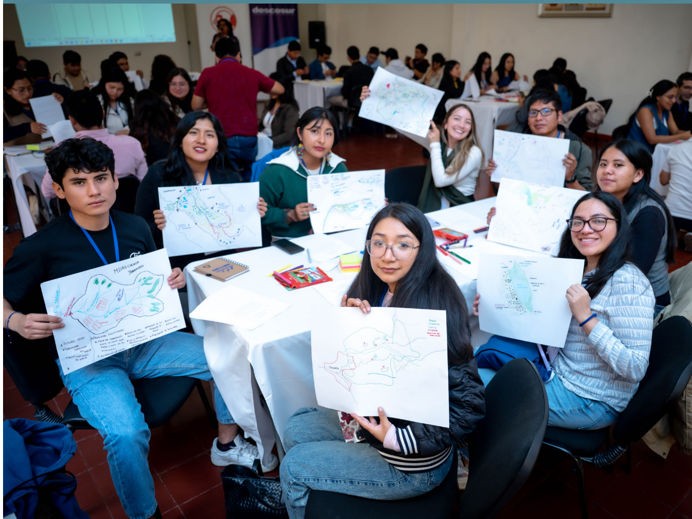
Con grandes expectativas cerramos el primer taller