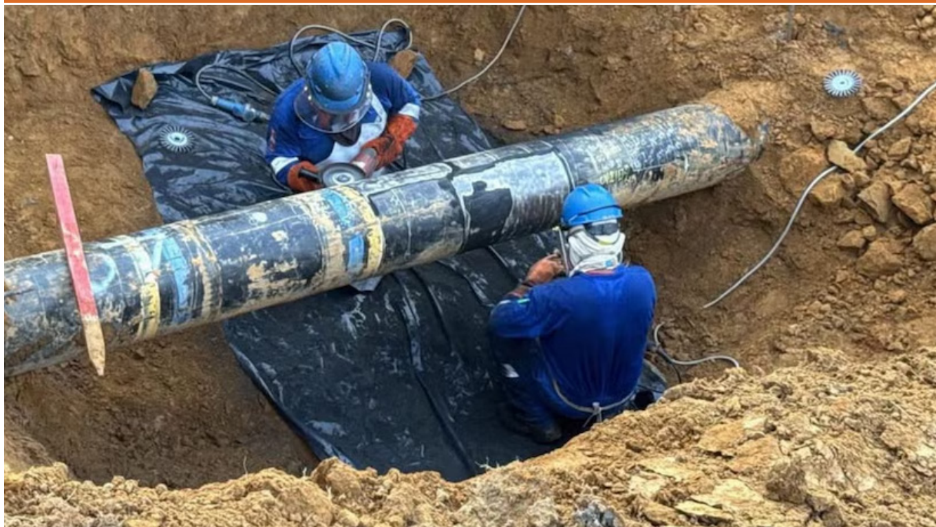
Casi dos semanas se tomó GTP para reparar el ducto de gas de camisea que dejó sin combustible a Lima y a muchas provincias del país.