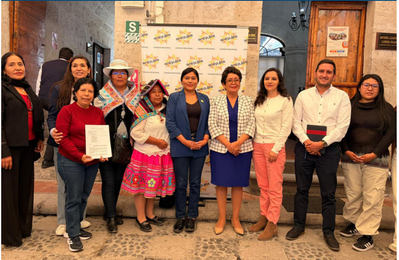
La Comisión de la Mujer del Consejo Regional y la vicepresidenta regional se comprometieron con la Red Sinchi Warmi para impulsar el COREMUCC.