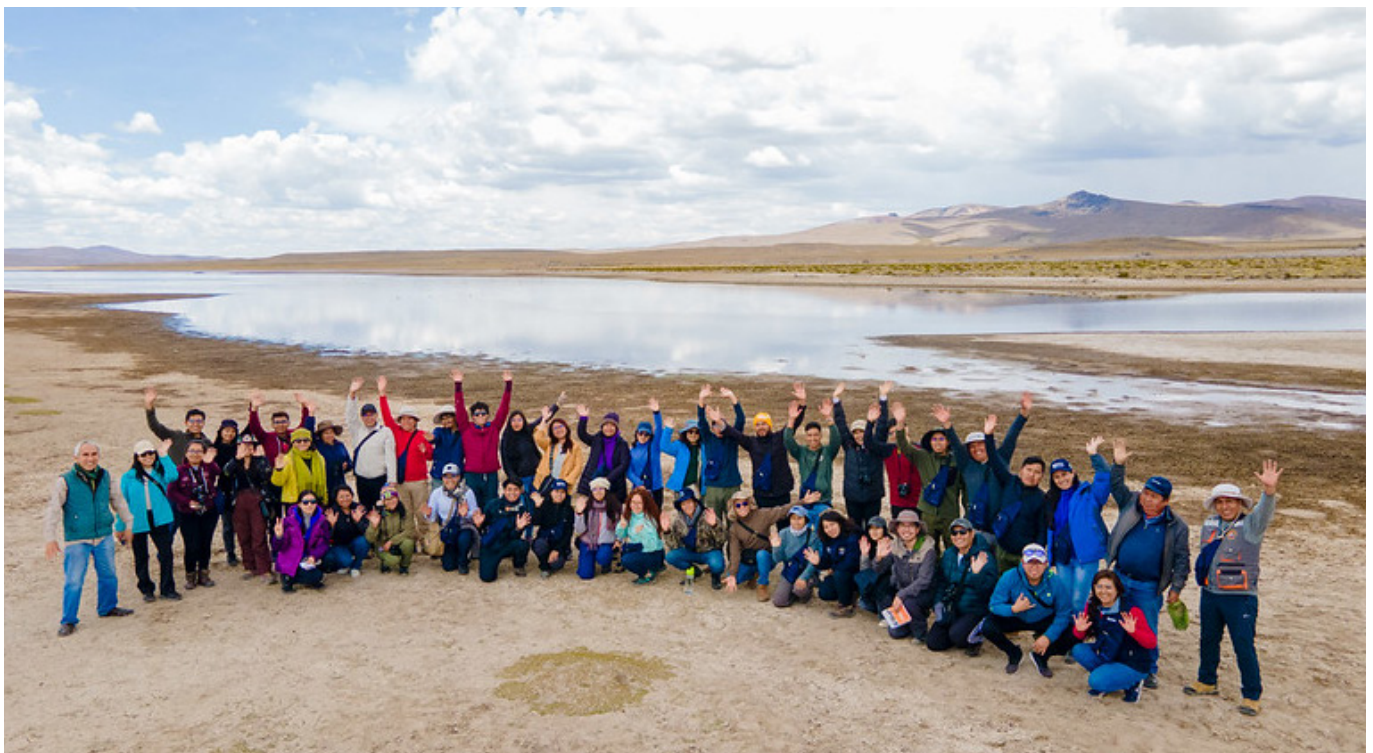
PEGMEAM 2024. Visita de campo a la Reserva Nacional de Salinas y Aguada Blanca

Asimismo, esta experiencia enriqueció el proceso formativo desde una perspectiva de género y diversidad de saberes, permitiendo reconocer el valor del conocimiento ancestral y