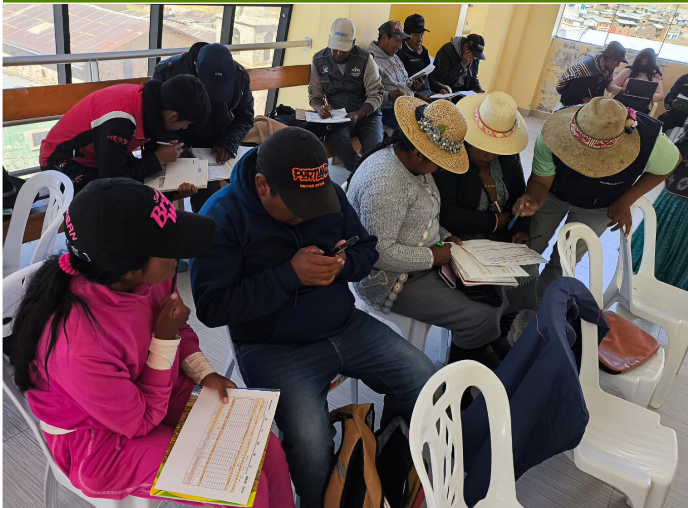
Reunión con las productoras y productores líderes del distrito de Santa Lucía (Puno) para evaluar los registros de empadre y parición de alpacas del año 2025. Los registros son parte del programa de mejoramiento genético de descosur.