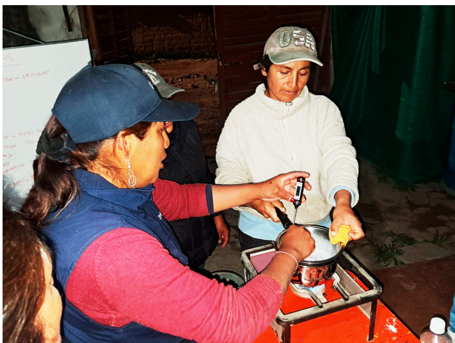
Preparación de jabones en el taller en San Sebastián de Sacraça.

2. Ejecutado por descosur y financiado por la Fundación Paz y Solidaridad de Navarra, tiene el objetivo de contribuir a la mejora de las condiciones de vida de familias campesinas de las provincias de Parinacochas y Paucar del Sara Sara, mediante el uso sostenible de los recursos naturales y el fortalecimiento de las cadenas productivas y la seguridad alimentaria en un contexto de cambio climático.