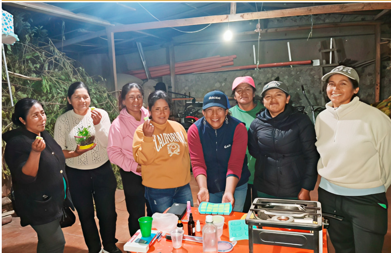
Taller con mujeres con la Asociación de productoras de tuna de San Sebastián de Sacra. Centro poblado de San Sebastián de Sacra.