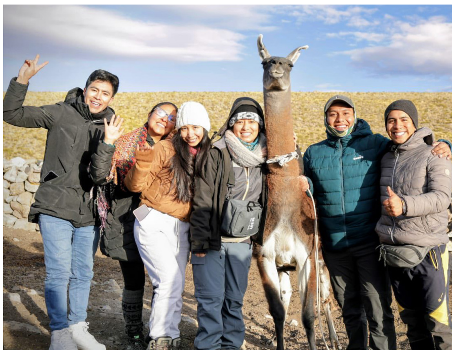
PEGMEAM 2025. Visita al CEDAT de descosur (Tocra - Caylloma).

En este marco, se espera que las y los egresados de esta edición se conviertan en agentes de cambio y líderes en la conservación y gestión sostenible de los ecosistemas de alta montaña, no solo impulsando la implementación de sus propuestas, sino también