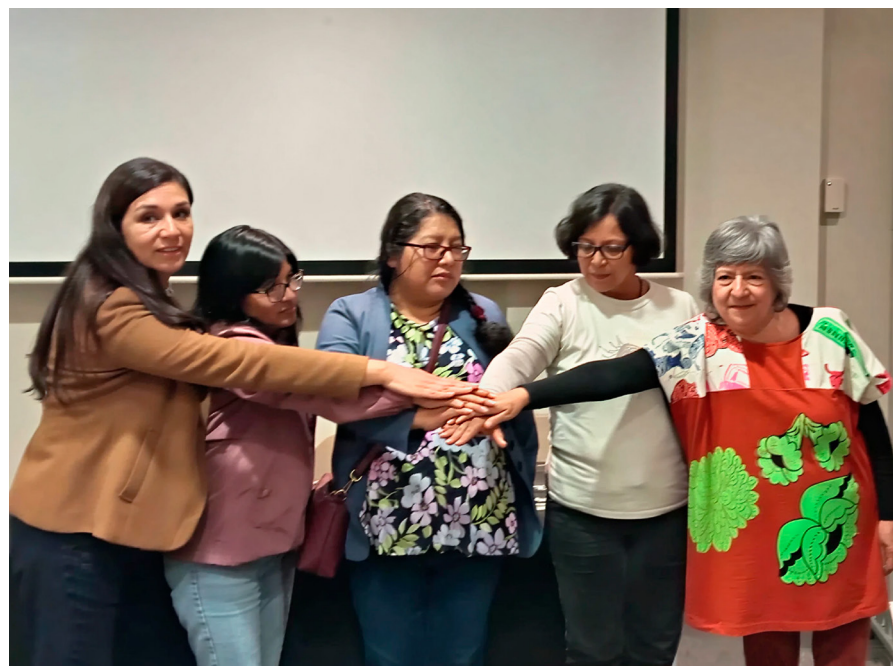
Comité Coordinador del CONAMUCC para el periodo 2026 - 2027.

El impulso regional para la conformación de la COREMUCC no ocurre de forma aislada. A nivel nacional, existe el Comité Nacional de Mujeres y Cambio Climático (CONAMUCC), impulsado por el Ministerio del Ambiente. Un grupo impulsor de la acción climática, conformado por organizaciones de mujeres e instituciones de la sociedad civil que trabajan en género y cambio climático, desarrollando acciones a nivel nacional. Inició sus acciones en octubre de 2019, convocando a la fecha a más de 50 organizaciones de mujeres y ONG a nivel nacional, grupo del cual formamos parte.