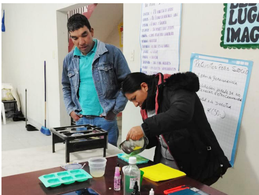
Taller con mujeres en el distrito de Marcabamba.