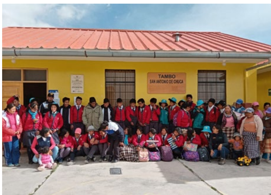
Los escolares son los mayores agentes de cambio en este tipo de proyectos.

“Los estudiantes del Quinto de secundaria estamos en desacuerdo con el nuevo planteamiento de las elecciones municipales escolares donde solo participan varones, en pleno siglo XXI cuando se promueve la igualdad de género no es posible que no se tome en cuenta la