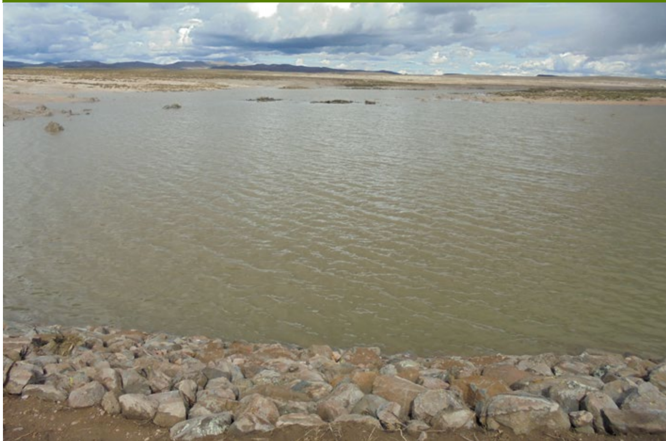
Microrrepresa de Palca.

E n los últimos años, los arequipeños hemos escuchado voces de alarma por la sequía, un fantasma que nos persigue como consecuencia del cambio climático. Por este hecho son recurrentes las noticias en la prensa sobre la cantidad de agua que tenemos en las represas y su capacidad. Para casi nadie es secreto el grave problema de colmatación por los sedimentos de la Represa de Aguada Blanca, una de las más importantes por el rol de regulación que cumple en todo el sistema de represas de Arequipa. La diferencia entre la capacidad instalada de la Represa Aguada Blanca (45 MM 3 ) y su capacidad de almacenamiento útil (30 MM 3 ), nos enrostra el problema.