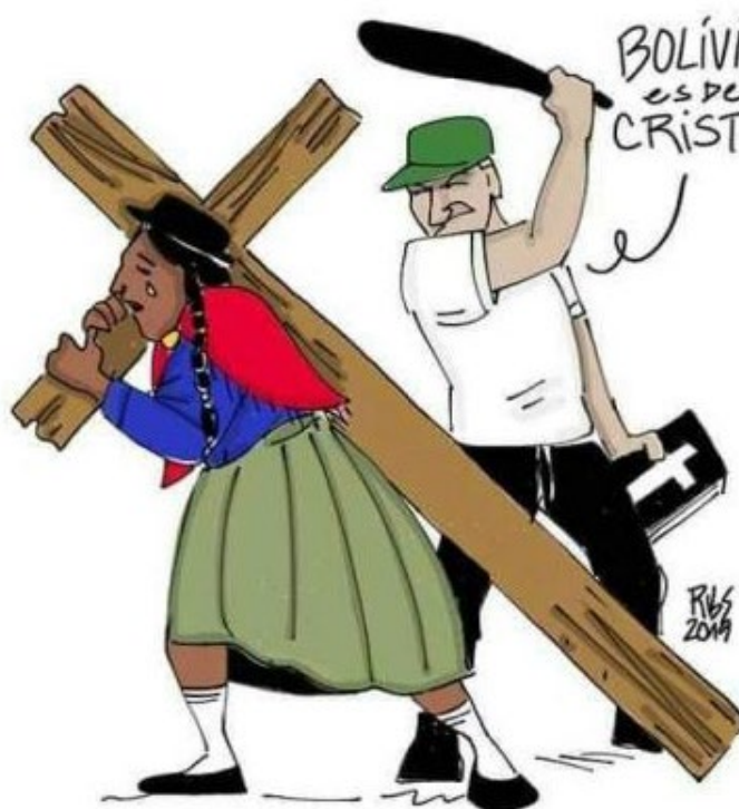
El golpe de estado en Bolivia tuvo claramente visos racistas.

Sólo poder social sin poder estatal deja en manos de las clases adine-