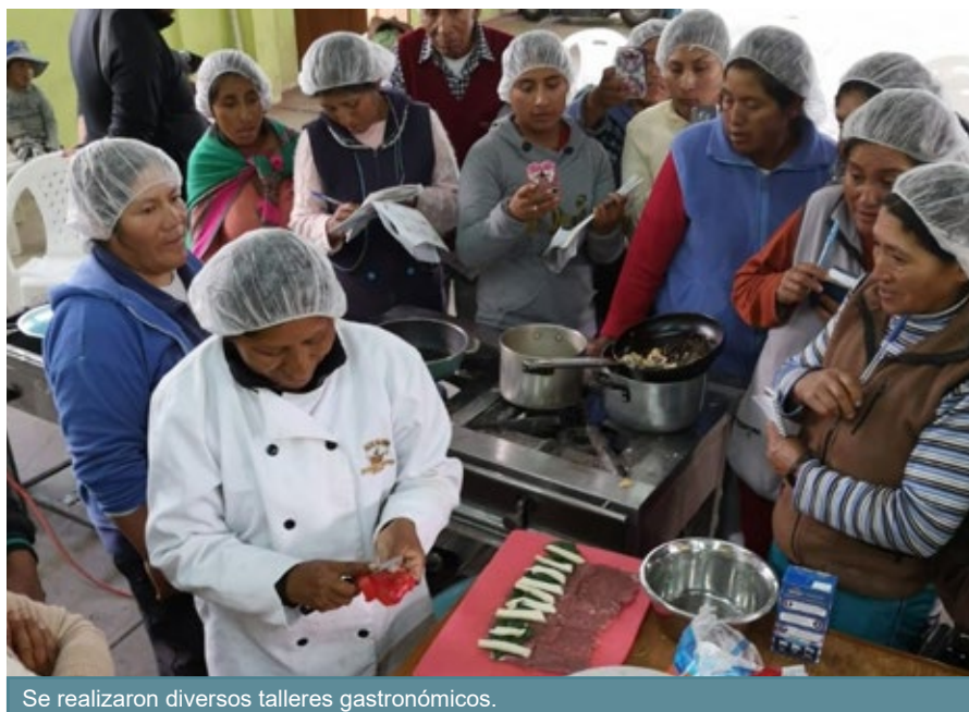
Se realizaron diversos talleres gastronómicos.

Es importante que las familias dedicadas al turismo comunitario elaboren un plan de gestión de riesgos para, entre otras cosas: implementen un botiquín de primeros auxilios; tengan a la mano un extintor; una mochila de emergencia; una agenda de teléfonos de emergencia; implementen un sistema de alerta temprana para la prevención. La gestión de riesgos debe verse como un elemento más de competencia, que incrementa la calidad del servicio.