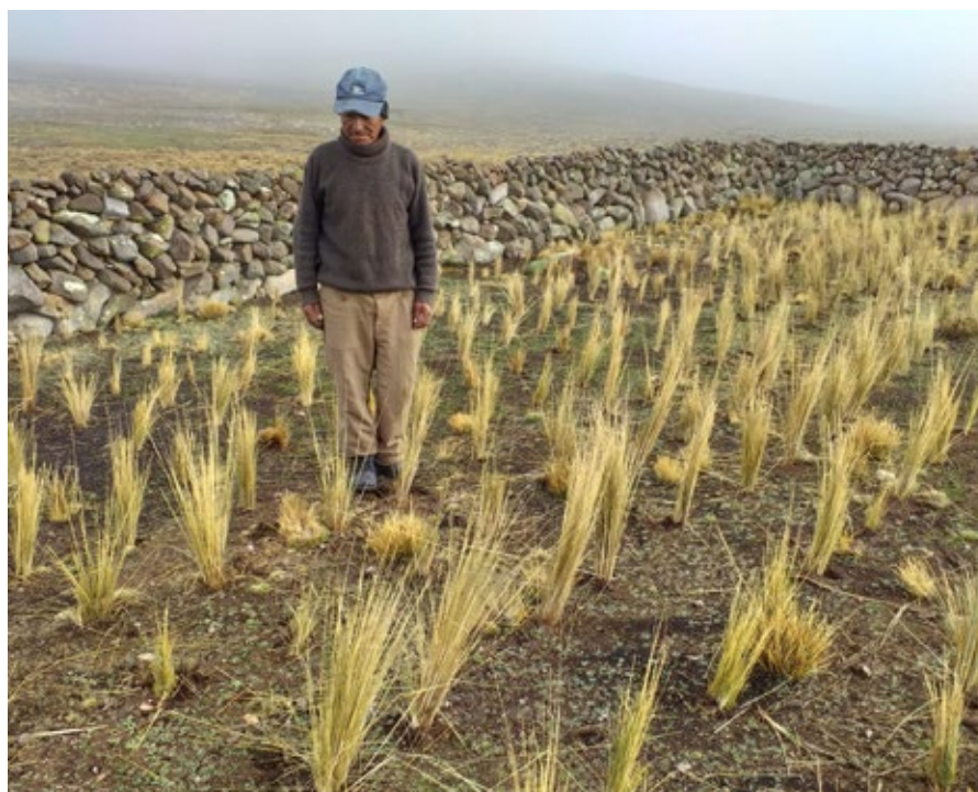
La chilligua es una especie para reforestar las zonas altoandinas.

Por último, se fortalecerá a las organizaciones existentes en la gestión de recursos naturales, su organización como usuarios de agua, y se impulsarán proyectos de conservación de recursos naturales ante sus gobiernos locales.