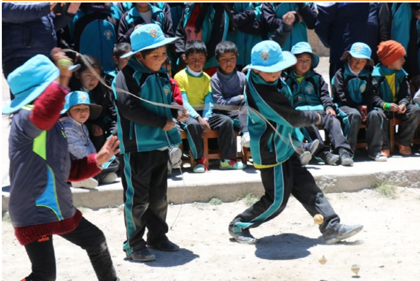
Concurso de juego de trompos en la I.E. Jose Antonio Encinas - Imata