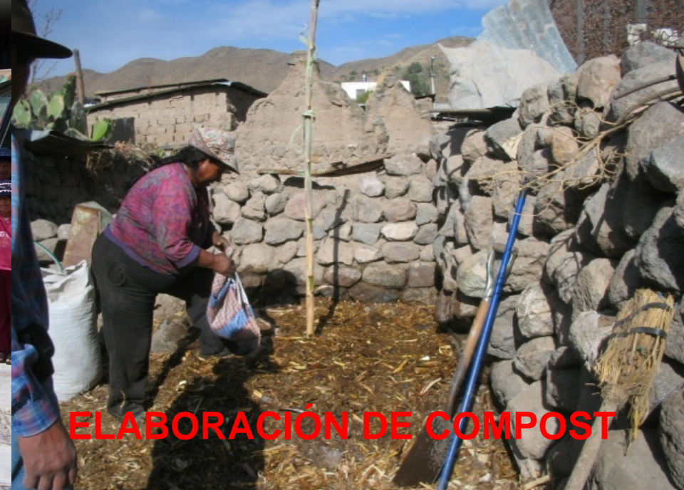
ELABORACIÓN DE COMPOST