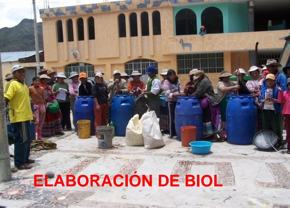
ELABORACIÓN DE BIOL