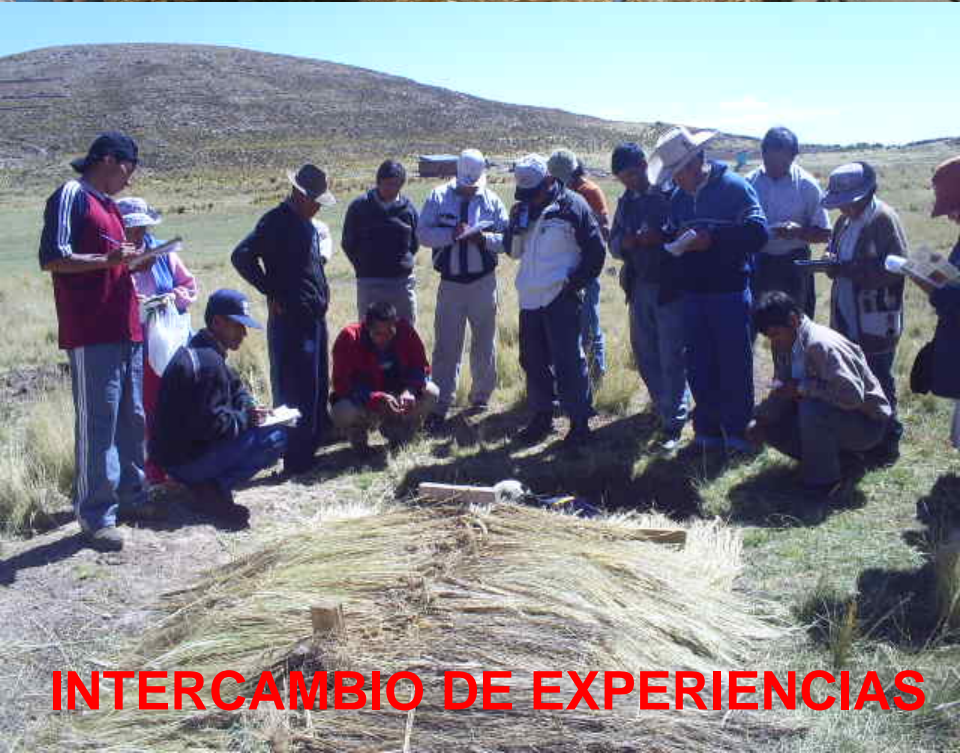
INTERCAMBIO DE EXPERIENCIAS