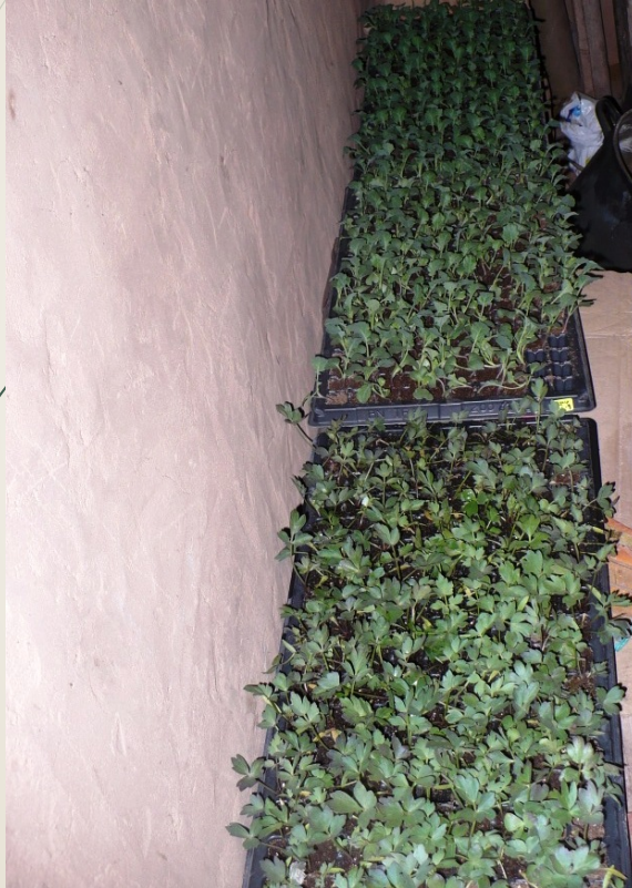
Disponibilidad de semillas.