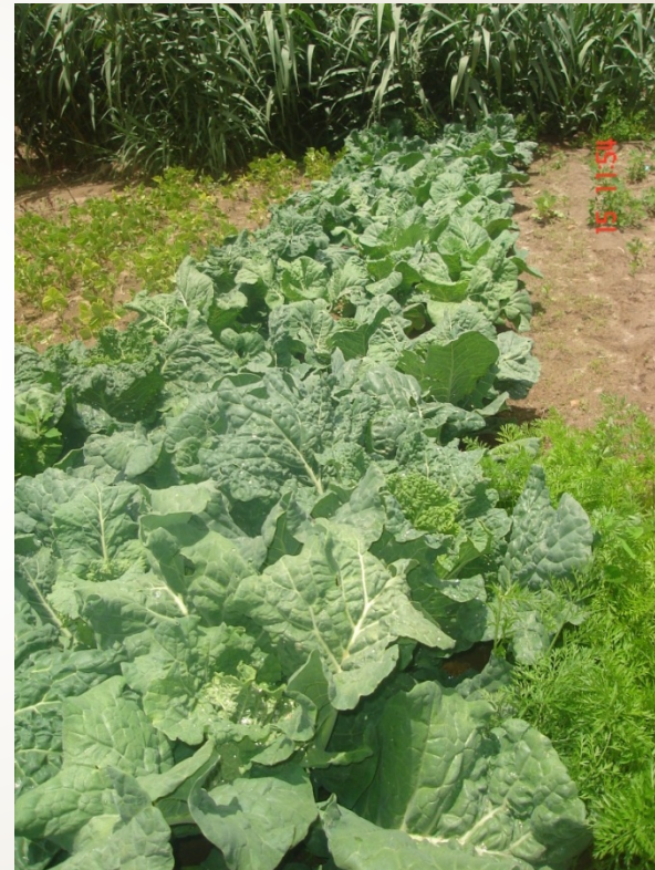
Siembra escalonada de cultivos