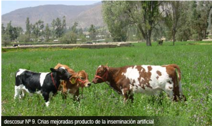
descosur Nº 9. Crias mejoradas producto de la inseminación artificial

Actualmente son 120 familias que participan en el programa de mejoramiento genético por inseminación artificial en vacunos. Se tiene 106 crías logradas, con un peso promedio al nacimiento de 41 Kg., frente al promedio de la zona de 32 Kg. y un promedio de fertilidad de 82%. Además existen en el momento 277 vacas preñadas 6 .