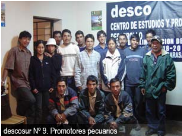
descosur Nº 9. Promotores pecuarios

Un efecto inmediato importante que se visibiliza, reconocida por toda la población, es la mejora de la calidad genética de las crías, que en algunos casos comienza a expresarse en la venta de crías machos de 7 meses al valor de S/.1,200.00 como reproductores, hacia distritos vecinos, situación percibida como un estímulo económico real por esta acción 7 .