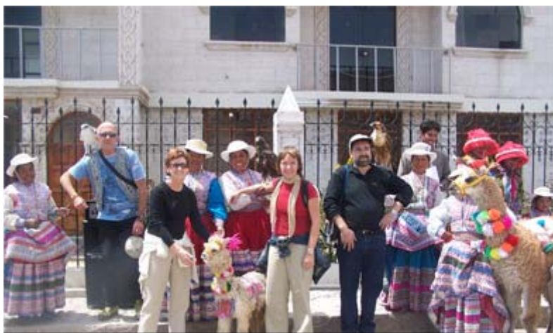
descosur N° 9. Visita de representantes de la Fundación Paz y Solidaridad de Navarra

Entre los días comprendidos entre el 30 de octubre y el 10 de noviembre del año 2006, la Unidad Operativa Territorial Caylloma, ha tenido la satisfacción de contar con la presencia de representantes de 2 contrapartes en la tarea del desarrollo.