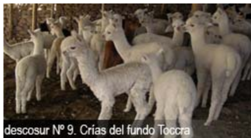
Cuadro Nº 1. Familias de alpacas conformadas en el CEDAT

apareamiento controlado bajo el sistema de uniones circulares (esquema donde se aparean en forma circular animales de familias diferentes y por lo tanto lejanas en términos de parentesco). Producto de estos empadres se obtuvieron un total de 256 crías, las cuales fueron sometidas al esquema de evaluación morfológica lineal al primer año de edad.