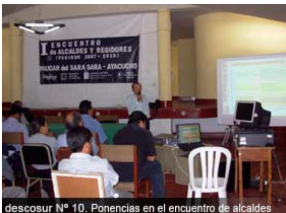
descosur N° 10. Ponencias en el encuentro de alcaldes

La agenda del encuentro centró el interés en la discusión de aspectos referidos a la importancia de la participación ciudadana en una gestión pública concertada y transparente, el proceso de la descentralización y democratización del país. Los aspectos relacionados a la operatividad cotidiana, como la estructura organizativa, la administración, los roles y competencias de las autoridades, se enmarcaron dentro de esta nueva imagen política del país.