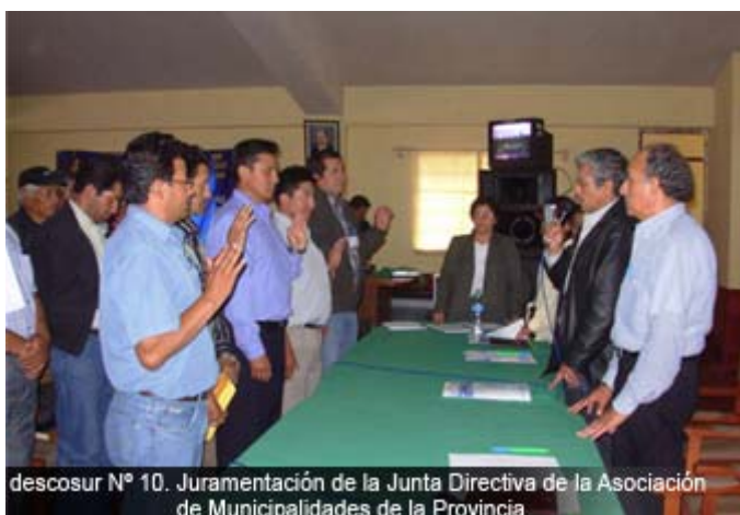
descosur N° 10. Juramentación de la Junta Directiva de la Asociación de Municipalidades de la Provincia

Páucar del Sara-Sara es una de las provincias jóvenes del país (22 años de creación) 1 , ubicada en el extremo sur de la región Ayacucho, desarticulada y aislada de los centros de decisión más importantes de la región y del país.