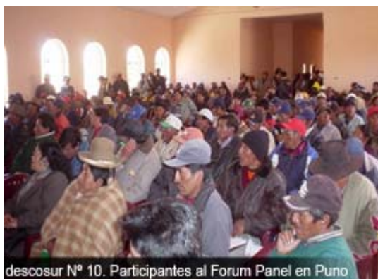
descosur N° 10. Participantes al Forum Panel en Puno