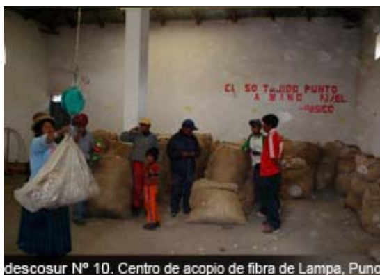
descosur N° 10. Centro de acopio de fibra de Lampa, Puno

promocionando en las ferias regionales de Juliaca y Puno.